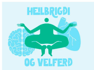
Heilbrigði og velferð