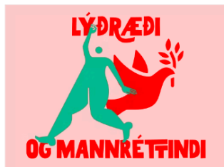
Lýðræði og mannréttindi