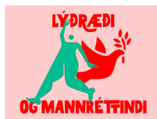
Lýðræði og mannréttindi