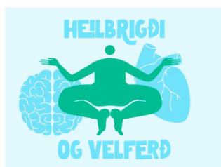
Heilbrigði og velferð